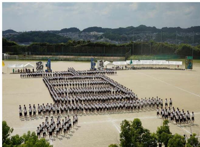
(昨年度プロムナード)

プログラム最後の種目であるプロムナード。限られた練習時間の中で極限の集中力を結集させて、一人一人が頑張る練習に取り組んできました。本校の伝統種目を最後までご堪能ください！